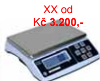
XX od Kč 3.200,- KPZ 2-03-10 M