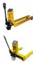
Příslušenství KPZ 71-7