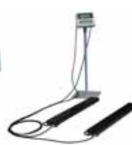
KPZ 1 B M