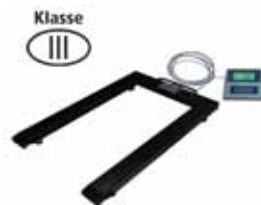
KPZ 1 M Ex Paletová váha