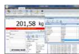
KPZ PC Software

Potřebujete jinou váhu, zvláštní produkty jsou naše specialita !