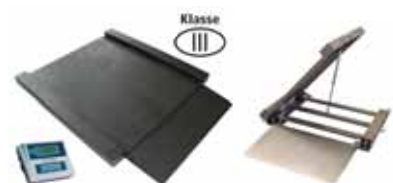
KPZ 2D M Ex Nájezdová (průjezdová) váha