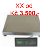
XX od Kč 3.500,- KPZ 2-11-3 M