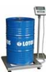
KPZ 2B M