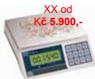
XX od Kč 5.900,- KPZ 2-03 M