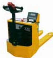
KPZ 72 M Ex Vážicí sada