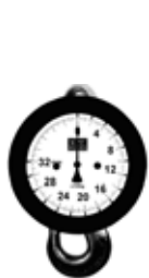
Jeřábové váhy M