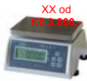
XX od Kč 3.800,- KPZ 2-03-10 M IP 65