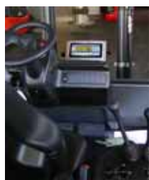
KPZ 39 Váha pro hydraulické vysokozdvížené zařízení