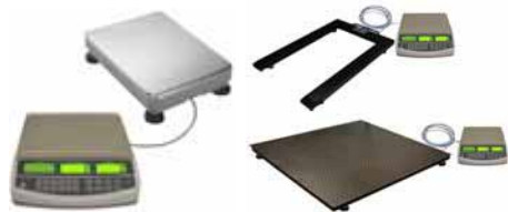
KPZ 2082 Systém počítacích vah