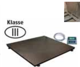
KPZ 2 M Ex Plošinová váha