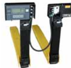
KPZ 76 M Váha na vysokozdvížené vozíky