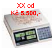
XX od Kč 5.500,- KPZ 2-04 M Počítací váha