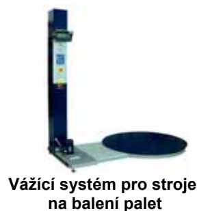
Vážicí systém pro stroje na balení palet