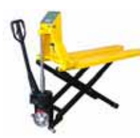
KPZ 74 Paletový vozík s váhou