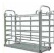
Váha na Zvířata M