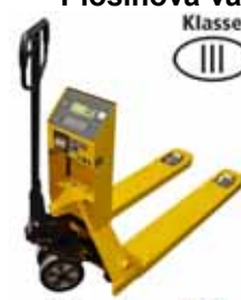
KPZ 71-* M Ex Paletový vozík s váhou