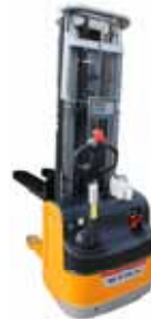
KPZ 73 M